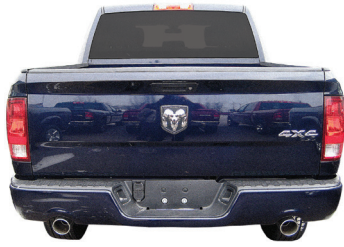
Ram 1500, 2500, 3500